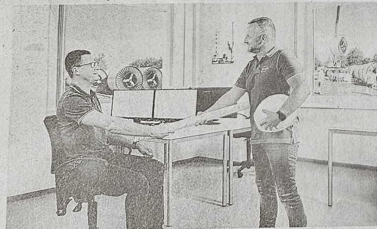
Mitarbeiter des Cteam müssen für ihre Arbeit enorme Datenmengen zwischen Baustelle und Firmenzentrale austauschen – daher setzt man auf die Anlagen von ConnectingCase.

erlässlich, so hat auch Cteam bereits eine hybride Lösung von Starlink mit 5G-Netzen bei einem größeren Projekt in Angermünde eingesetzt und von den bestmöglichen Eigenschaften beider Netze in Sachen Signalstärke und Latenzzeiten profitiert. Weiterhin werden derzeit Anlagen von ConnectingCase auch für die Anbindung einzelner Bauglagers mit größerer Container-Landschaft in Cloppenburg sowie auch bei einem Sanierungsprojekt an der B116 Isar-Ottenhofen und beim Bau der neuen Utranet-Verbindung eingesetzt, die nach Projektabschluss Gleichstrom von Ost nach West in Nordrhein-Westfalen bis nach Friedrichshafen in Baden-Württemberg führen wird.